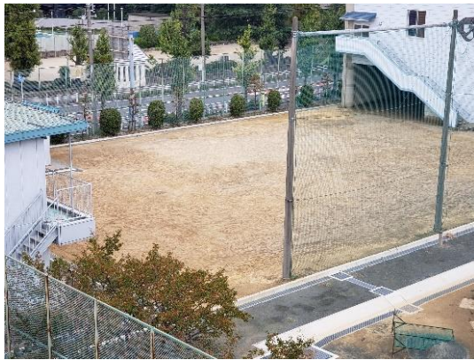
北部中学校のテニスコート

A・プールの在り方については、今後、共同利用や民間プールの活用等検討していきたいとの答弁。