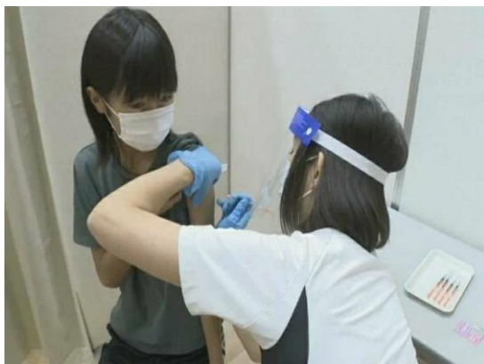
小中学生のコロナワクチン集団接種開始

歳入では、市税において個人市民税の賦課の結果による増額や、普通交付税の算定結果を反映し、今回も財政調整基金に、10億円を積みもどしました。その結果、一般会計で増額、25億4,740万4千円、特別会計で増額、6億7,337万8千円、企業会計で減額、3,466万9千円、全会計では増額、31億8,611万3千円の補正額としました。