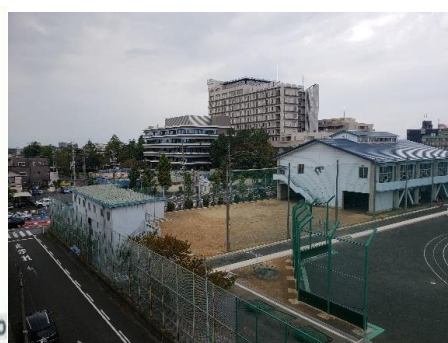
まちなかにある学校敷地