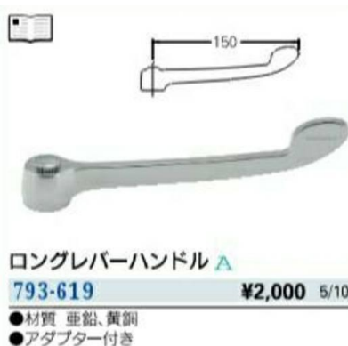
手洗い場のレバー式水栓ハンドル

市内業者様から、ご寄付をいただき小学校の手洗い場に設置させていただくこととなりました、「レバー式水栓ハンドル」コロナ対策として。北部中学校の学校敷地内に、テニスコートの新設を求め、現在2面あるコートを改修して、1面ですが試合の出来るコートへ生まれ変わります。感染防止を防ぐために、ワクチン接種にご協力をお願いいたします。引き続き感染対策もお願いします。