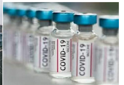
頼みの綱、コロナワクチン