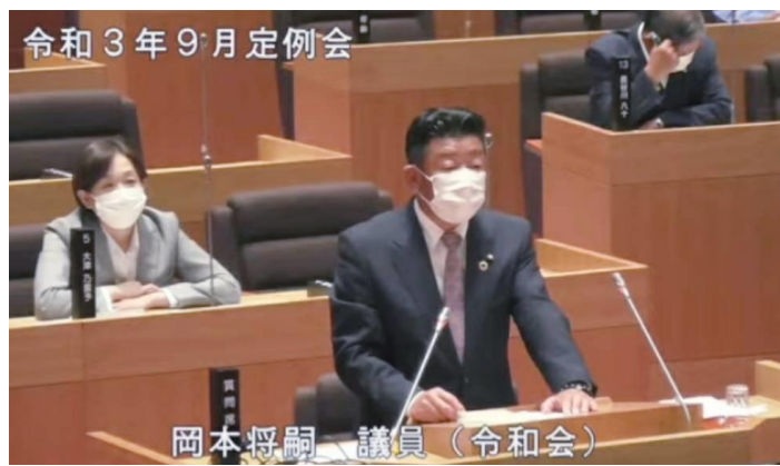
9月議会・一般質問登壇

などを、新型コロナウイルス感染症対策では、多くの市民の方が利用される公民館などの公共施設において、換気が悪く密閉空間となる危険がある空調設備の改修費用や、高齢者福祉施設のトイレの蛇口を介した感染を防ぐための自動水栓化などを計上しました。