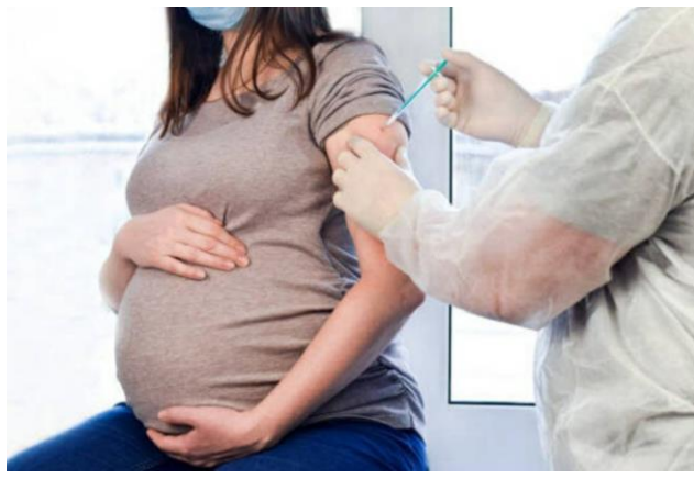
妊婦さんへの優先接種開始