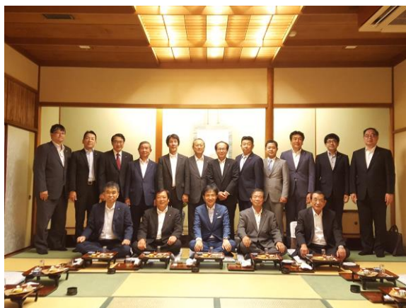
9月定例会・閉会后、新公会懇親会

なお、追加提案されました、小信調整増設工事(躯体工事)の請負契約の締結、一般会計及び特別会計の決算の認定、各会計決算に係る健全化判断比率の報告、教育委員会委員及び監査委員の人事同意案件も全て議いたしました。