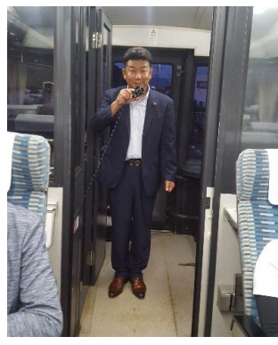
貸切列車・車掌室から挨拶