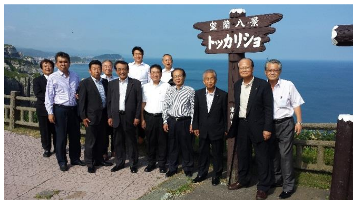
新政会の行政視察、室蘭地内にて

左から、先日7月1日から3日まで会派の行政調査で北海道千歳・室蘭・小樽市と行かせていただきました。室蘭地球岬での1枚。真ん中は、今年4月からわが子も1年生になり、貴船小学校に通わせていただいております。ランドセルを背負って毎日喜んでます。右の写真は、地元の方より私のイメージをロゴにいただきました。これから、このロゴをいろいろな場面でご披露させていただきます。