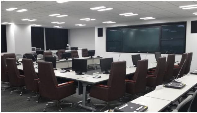
災害対策本部として開設されたシステム