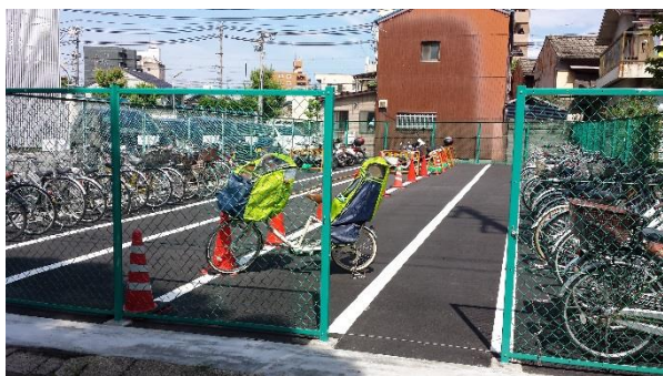
貴船連区、防災倉庫跡地に駐輪場