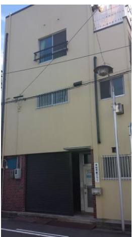
←貴船児童クラブ、貴船児童館の写真↑

市内、児童館のみの小学校校区は19校区、児童館と児童クラブがある小学校校区は6校あります。その他児童クラブのみの校区は17校区あり、そのうち2施設ある校区は4校区。