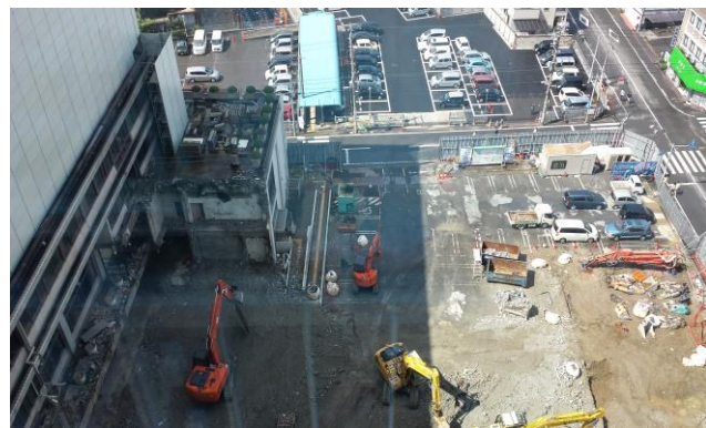
旧庁舎の解体現場(新庁舎12階から撮影)

れました。 なお、追加提案されました、新庁舎(第2期)自走式立体駐車場建設工事の請負契約締結、平成25年度一般会計・特別会計決算の認定、任期満了に伴う教育委員及び公平委員選任の同意案件、任期満了に伴う人権擁護委員の推薦諮問案件についても同様に決議し閉会いたしました。