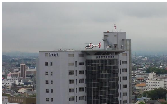
ヘリポートに着陸した、ドクターヘリ。

今年5月はじめに新庁舎が14階建てになり、12階の我々市議会の執務室から見る景色も大変すばらしく、ふと北側を見れば一宮市民病院・総合大雄会病院が目に入ります。屋上にはいずれもヘリポートがあり、活用状況がどのようになっているのか尋ねました。