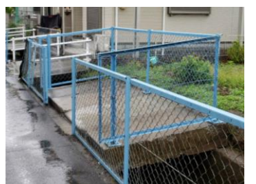
ゴミステーション設置