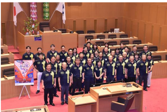
6月議会 閉会日、七タルックにて

平成30年度一般会計補正予算の専決処分並びに地方税法の改正に伴う一宮市市税条例等及び一宮市国民健康保険税条例の一部改正の専決処分の承認。固定資産評価審査委員会委員の人事同意案件、人権擁護委員の諮問案件全てを同意・承認いたしました。