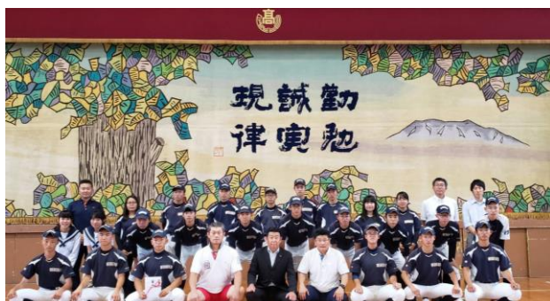
母校、尾北高校野球部激励会