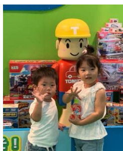
二人の孫、犬山モンパにて

久しぶりの犬山モンキーパーク、孫たちも大喜び、トミカの世界で楽しんでいました。全国高校野球、夏の大会予選が始まります。野球部OB会長として役員方々と激励会として訪問。1勝1勝を大切に。カラス問題、ゴミの集積所を狙うカラス。東島町内に新たなゴミステーションを設置。道路幅員が狭いため、水路上への許可申請を提出。あとはネットを張って完了です。